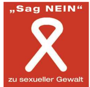
Günter Haverkamp Aktion Weißes Friedensband e.V.